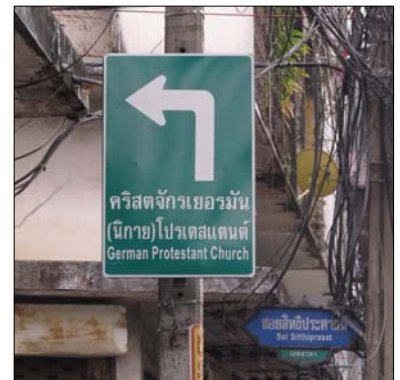
Abzweig in die Soi Sitthi Prasat von der Soi Suwan Sawat

Wenn Sie mit öffentlichen Verkehrsmitteln anreisen, steigen Sie in der MRT (U-Bahn) Station Lumpini aus (Exit 1, Richtung Soi Ngam Duplee) und gehen am Ausgang rechts die Rama IV ca. 350 m in östlicher Richtung bis zur Einmündung der Soi Suwan Sawat. Von ihr zweigt nach ca. 300 m links die Soi Sitthi Prasat ab.