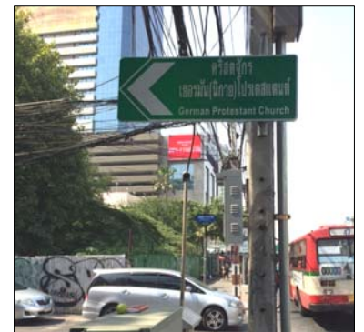
Abzweig in die Soi Suwan Sawat von der Rama IV Road