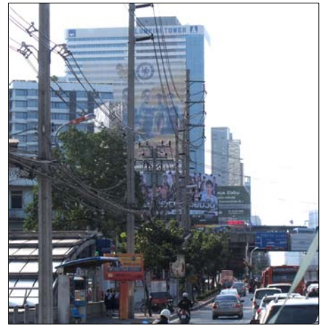
Lumpini Tower an der Rama IV Road von der MRT Haltestelle Khlong Toei aus gesehen

Wie auch immer Sie anreisen – Seien Sie herzlich willkommen!