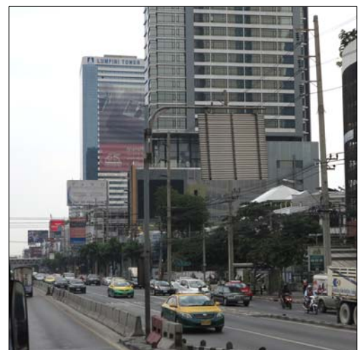
Lumpini Tower an der Rama IV Road von der MRT Haltestelle Lumpini aus gesehen

Wenn Sie mit öffentlichen Verkehrsmitteln anreisen, steigen Sie in der MRT (U-Bahn) Station Lumpini aus (Exit 1, Richtung Soi Ngam Duplee) und gehen am Ausgang rechts die Rama IV ca. 350 m in östlicher Richtung bis zur Einmündung der Soi Suwan Sawat. Von ihr zweigt nach ca. 300 m links die Soi Sitthi Prasat ab.